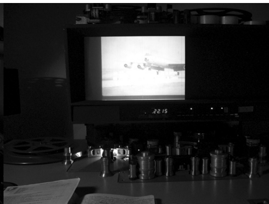
FIGURA 3 Imagem “re-ancorada”.